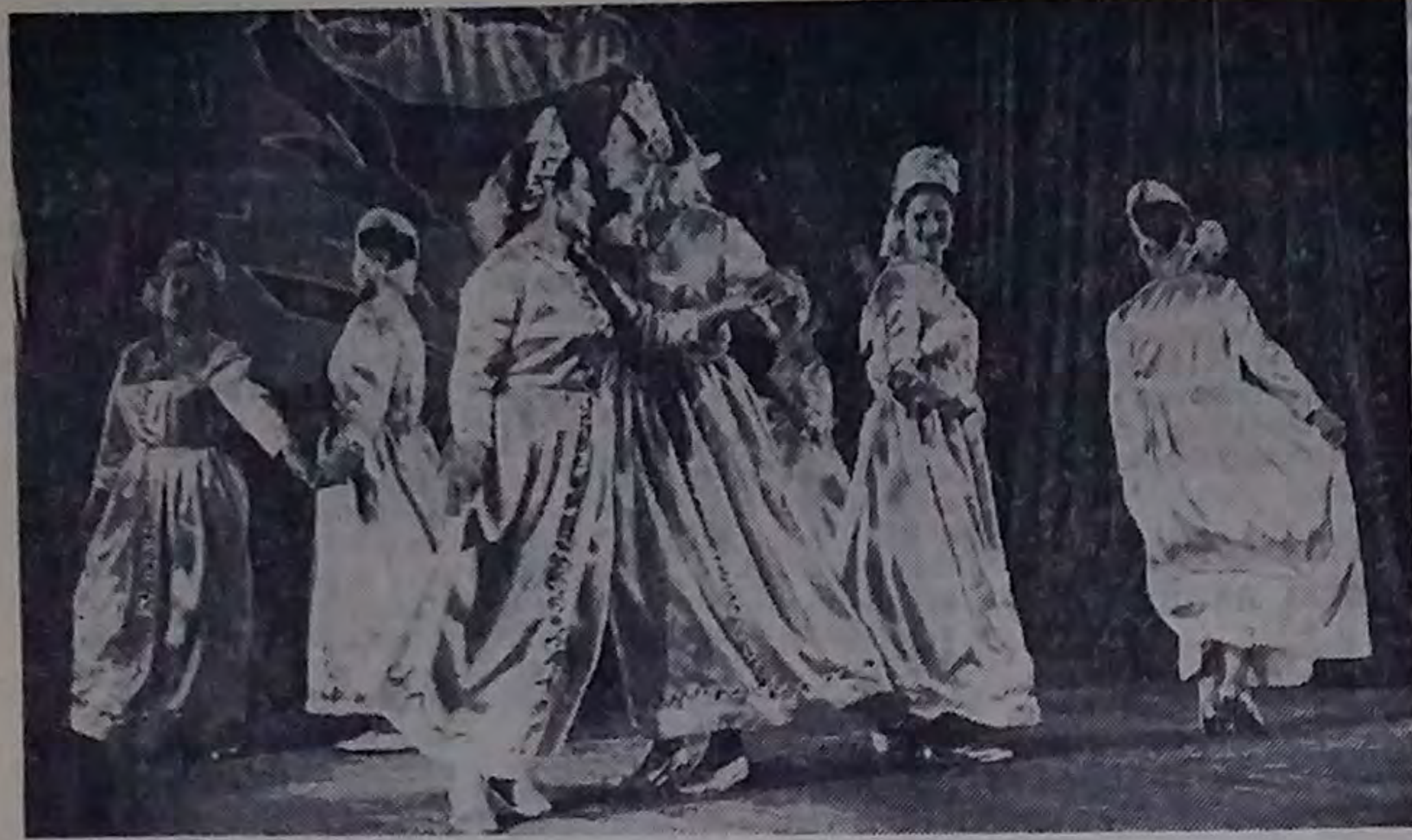
Большим успехом пользуются выступления танцевальной группы Темкинского Дома культуры. На снимке: выступает танцевальная группа.