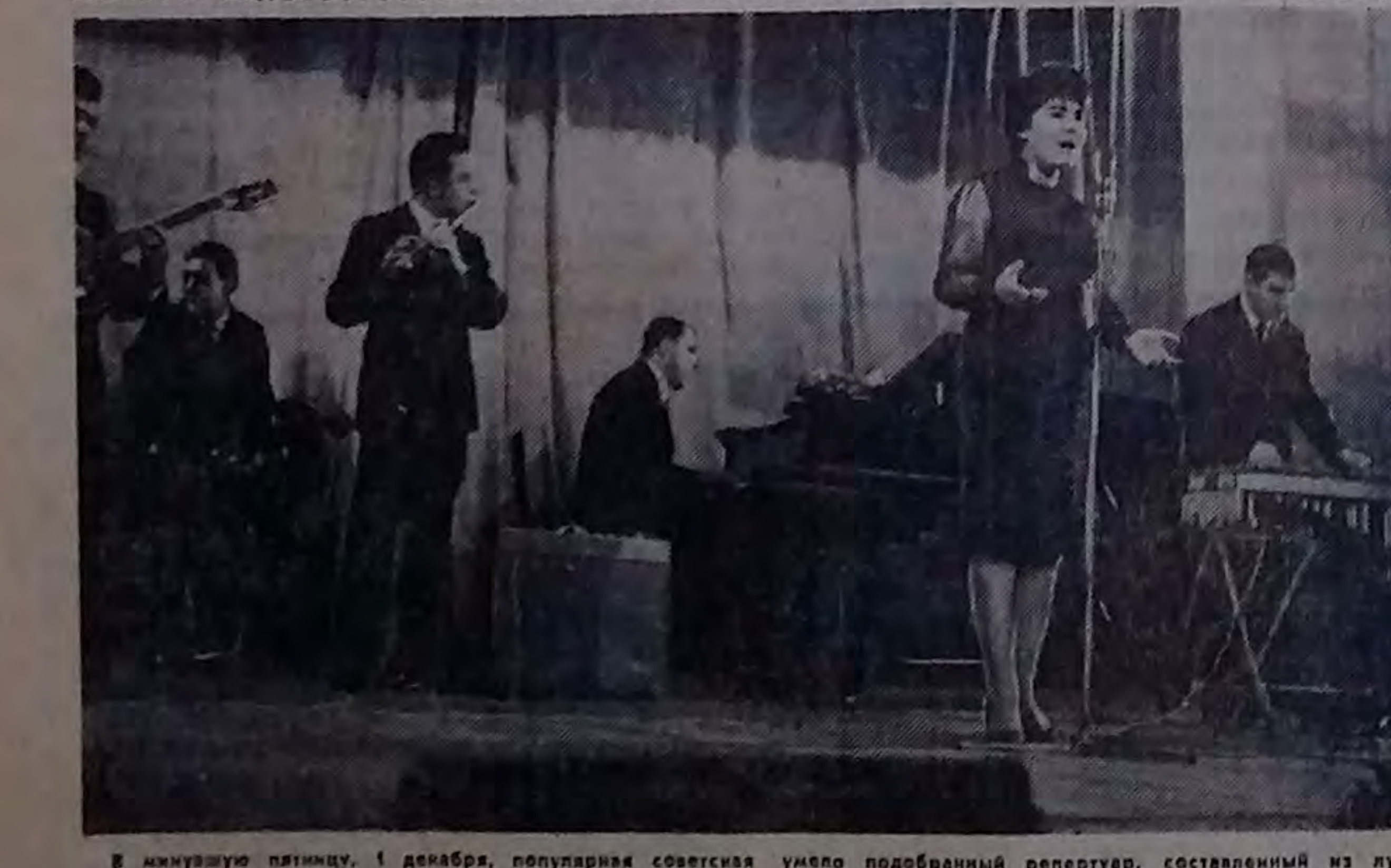
В живую птичку. 4 декабря, популярная советская певица Майя Кристалинская дала свой первый концерт в Смоленске. Она выступила перед вторыми зрителями и журналистами газеты «Рабочий путь», которые собрались на торжество по случаю награждения газеты «Рабочий путь» Трудовой Красною Знаменкой. Новаторская творческая работа исполнителя, задушевность, искреннее мастерство.

В чем дело? Этот вопрос волнует многих читателей газеты.