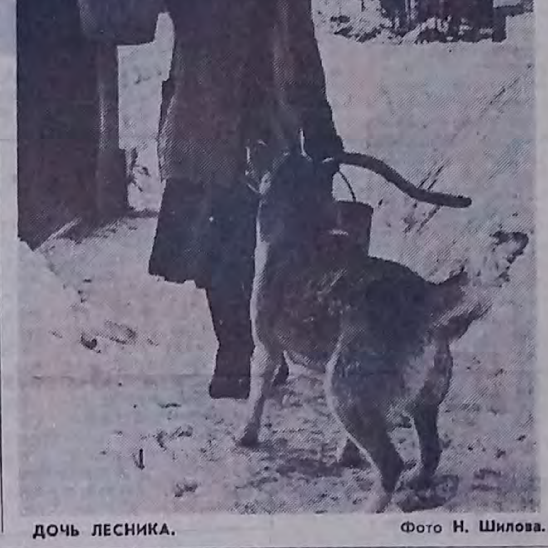
ДОЧЬ ЛЕСНИКА.